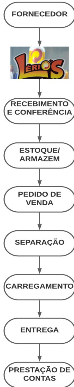
Figura 1: Fluxo da gestão logística da empresa.