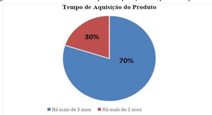
Figura 1: Gráfico ilustrando o tempo de aquisição dos produtos pelo cliente.

Os dados obtidos na coleta foram divididos de acordo com o objetivo proposto na pesquisa, dessa forma, as cinco questões referentes à percepção dos clientes sobre a satisfação no pós venda se iniciam com a primeira indagação quanto ao tempo de aquisição do produto na loja Magazine Luiza de Cajazeiras-PB.